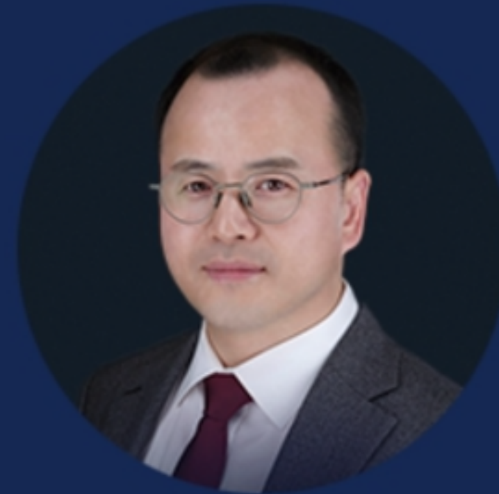
안순사 변호사 법무법인 율사서재